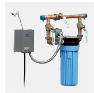
Contournement de filtre à eau