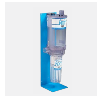
Séparateur d'amalgame NXT Hg5