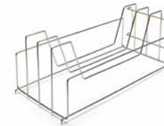
9A703001 – SUPPORT DE CASSETTES VERTICAL (modèles de stérilisateur à vapeur M11 uniquement)