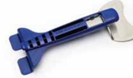
9A307001 – OUTIL DE RETRAIT (pour plateaux et cassettes)