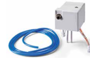
9A694001 – REMPLISSAGE AUTOMATIQUE 115 V (9A694002 – Remplissage automatique 230 V disponible)