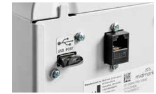
9A698001 – TROUSSE USB Téléchargez les données des cycles, y compris la durée, la température et la pression. Comprend une clé USB, un câble USB et une carte PC (installation par un technicien requise).